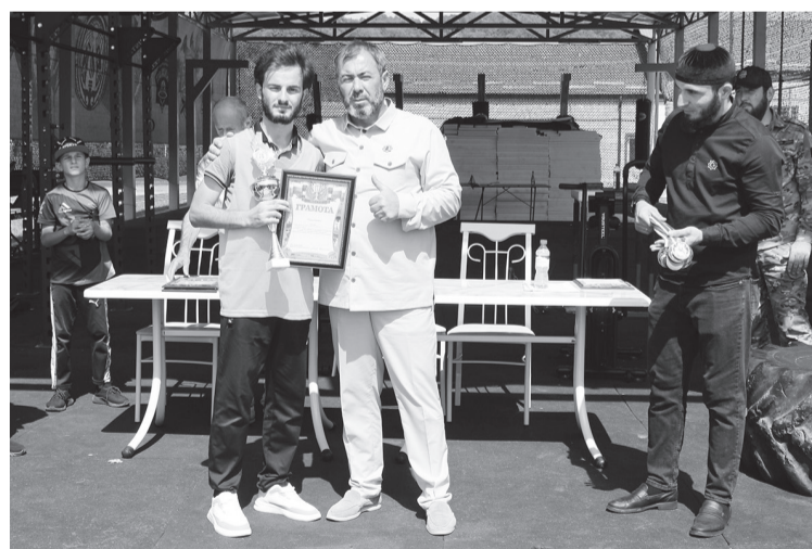
Награждение команды Веденской ЦРБ

P.S. Радостная весть пришла в этот праздничный день в Веденский район: футбольный клуб «Ведено» занял первое место в Кубке Чеченской Республики по мини-футболу, посвященном 71-й годовщине со дня рождения Первого Президента Чеченской Республики, Героя России Ахмата-Хаджи Кадырова. Поздравляем футболистов ФК «Ведено» и всех жителей Веденского района с этим успехом.