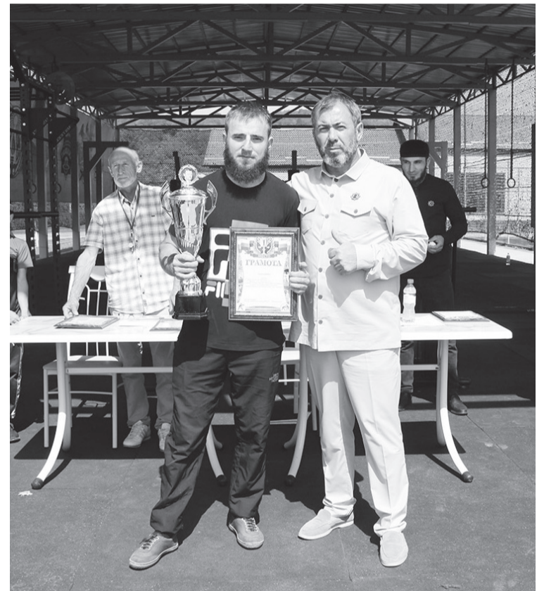
Награждение команды Веденской районной Администрации

тали на стадионе с. Махкеты. Здесь победителями мини-футбольного турнира стали гости из с. Новые Атаги Шалинского района, которым был вручен кубок им. Первого Президента, Героя России Ахмата-Хаджи Кадырова, дипломы первой степени и золотые медали. Вручением кубка, дипломами второй степени и серебряными медалями отмечена завоеванием