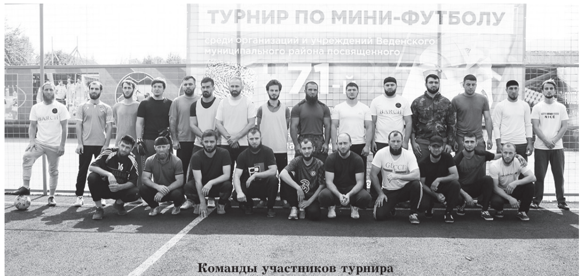
Команды участников турнира

По итогам трехчасовых баталий удачливее и сильнее оказались футболисты Администрации Веденского района, которые завоевали главный кубок,