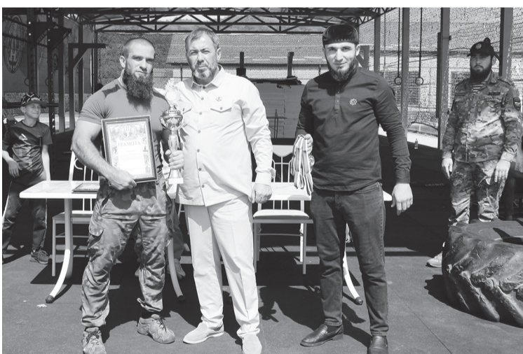
Награждение команды ОМВД России по Веденскому району

ная команда «Шали» Шалинского района, которая удостоилась кубка и бронзовых медалей.